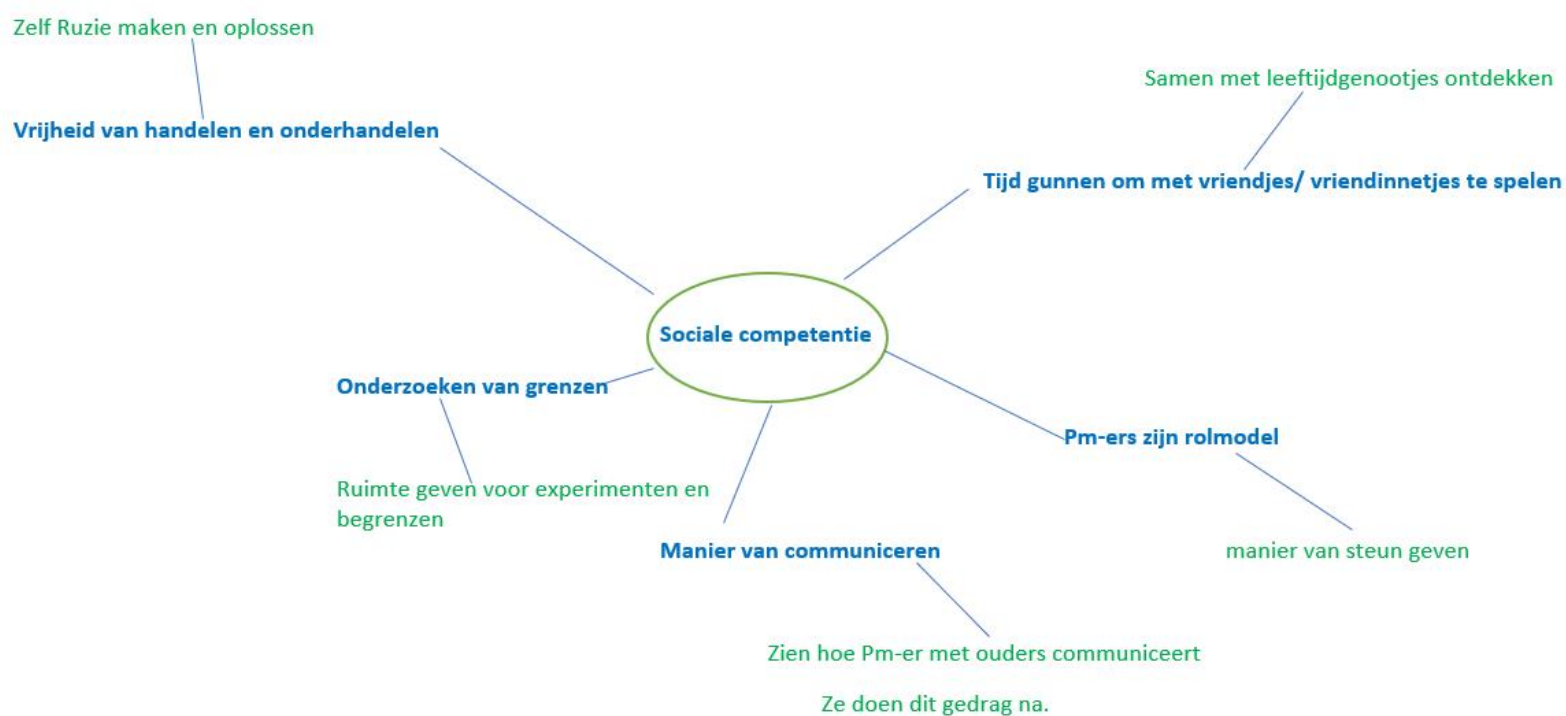
Figuur 1 Overzicht van de sociale competentie